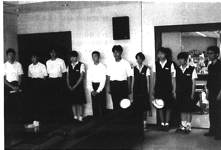
8月10日、黒中の生徒が町長室を訪れ、各種大会出場を報告する

友情のネットワークを作りませんか 身近な地域に果す女性の役割、豊かな家族生活のあり方や、国際的な視野に立った生活を学んでみませんか。 ▼対象 六十五歳以下の女性 ▼参加費 一人一五〇〇円(資料代)その他実費 ▼内容 広報八月十五日号をご覧ください。 ▼開催時間 午後一時三〇分～午後四時(初回のみ午後十二時二〇分) ▼会場 黒埼町公民館講堂等(初回のみ開講式後市民プラザ) ▼定員 三〇名(八月二十五日から受付) ▼申し込み 問い合わせ 町教育委員会社会教育課(三三七七-二二〇一)