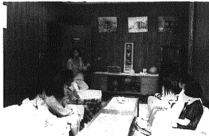
日本青年館の視察

その後は、自由ヶ丘や横浜、すみだ川の花火大会などを見物しました。今年は冷夏で東京は新潟よりも寒かったです。