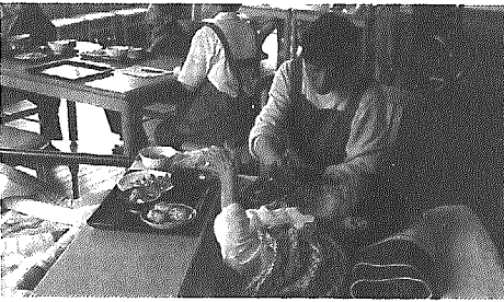
食事の世話をするヘルパー

るものはすべて行っている。月30人ぐらい。内容は食事の世話、買物、洗濯、生活に関する助言など。デイサービスは8人体制で1日12人ぐらいサービスしている。なお、一人暮らし老人世帯は昨年4月1日現在で147世帯となっている。⑧担当課長と相談しているが、ギャップがあるようだ。よく詰めた中で対処したい。⑨充分調査して対処したい。 保健衛生課長 ⑤補助基準面積が770㎡で、それより大きくするかは今後検討したい。また、(仮称)健康づくりセンターを併設したいという事で検討中だが、全体で1400㎡を想定している。