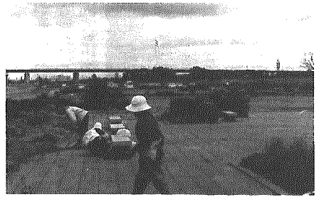
公園の草取りをするお年寄

F議員 高齢者福祉について ①高齢化の進行に伴う町の施策 ②次の例示のものは実施可能か(1)デイホーム(高齢者を一日面倒見る託児所のような施設)(2)体の一部が不自由な人が機能回復訓練をする施設の提供(3)寝たきりの人の入浴サービスを自宅まで風呂を持ち込んでやれるか ③シルバー人材の増加に際し町長の「シルバー人材」の概念 ④達者な老人で働く意欲のある方をシルバー人材として登録し、職を紹介することは可能