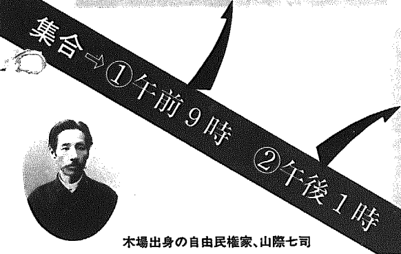
木場出身の自由民権家、山際七司

史跡ピクニックと ○×クイズラリー ④午前9時 木場多目的施設に集合 木場八幡宮、満行寺 ④木場の史跡を歩いて訪ねます。黒崎の歴史についてのクイズもあるよ。④などたでも ※昼食はご持参ください(満行寺で昼食) ※雨天の場合は満行寺で史跡等の解説 クイズなどを行います。