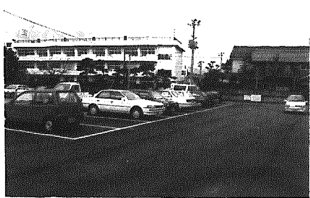
大野小学校前駐車場

また管理上の責任については、 駐車した人に対応してほしい。 総務課長 ④2、3台あるよ うだ。北場部落と相談して農 繁期には柵をすることにした。