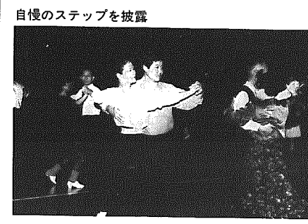
自慢のステップを披露

第7回町民ダンスパーティー 十一月二十三日(月)、総合体 育館で第7回町民社交ダンス パーティーが黒崎町公民館と 黒崎町社交ダンス協会の共催 で開催されました。町内外か ら約五百人の参加者が集まり ました。CDなどによる演奏 でたっぷりと三時間踊りまし た。寒い天候だったにもかか わらず、会場は参加者の熱気 で盛りあがっていました。