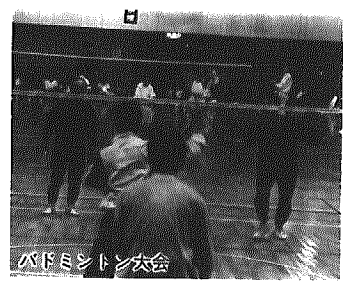
バドミントン大会

◎第11回黒崎町小学生卓球大会の お知らせ 1月24日(日) 総合 体育館 ※応援をお願いします。