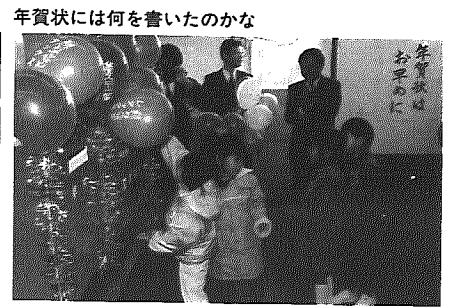
年賀状には何を書いたのかな

年賀ハガキの受付は毎年十 二月十五日から始まります。 大野町郵便局ではこの日、興 野保育所年長さん園児二十七 人を招き、年賀ハガキの投函 式を行いました。園児の代表 がクスマを割ったあと、お父 さん、お母さん、友だちに心 を込めて書いた年賀状を次々 に投函しました。最後に記念 の風船をもらい大喜びでした。