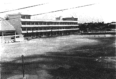
大野小グラウンド