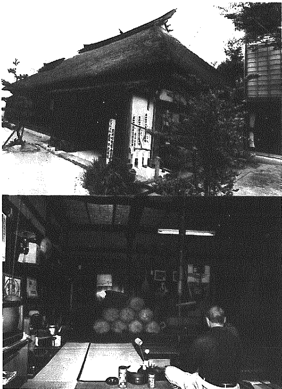
写真上/常民文化史料館。緒立八幡宮のわきにあり、老人福祉センターもすぐそばにある。付近には新潟流通センターができているほか、土地区画整理事業も進み、大きく環境が変わろうとしている。写真下/常民文化史料館内部。本文にもあるとおり三百年近くの歴史を持つ茶の間である。

当町の西北端にあたる緒立に常民文化史料館があります(昭和四十六年開館)。木造茅ぶき屋根の建物と木造二階建ての新しい建物(展示室、昭和六十二年完成)からなっており、かつて黒崎近辺で使わ