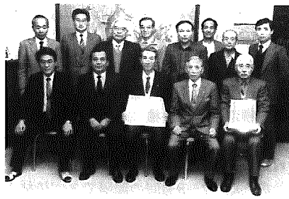
第14回国民年金市町村広報コンクールの総合部門で黒崎町が県知事賞を受賞。平成2年度中の広報活動で、文化祭の国民年金コーナーなどが評価されたもの。写真は受賞を喜ぶ国民年金委員の皆さん。