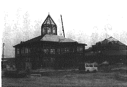
建設中のBeinくろさき

C議員 Beinくろさきについて。町長 株式会社黒崎町特産館は去年の10月27日に創立総会を開催、10月29日設立登記を完了している。建築工事は去年11月に発注、工期は5月15日までとなっている。オープンは7月17日予定で、イベント・宣伝などについても新潟ふるさと村管理運営協議会が4月に入ってから組織され協議されることになっている。1階が物販販売、2階がレス