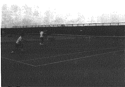
寺地テニスコート

C議員 町内スポーツ施設について、施設の管理、営繕状態は。町長 総合体育館は教育委員会で管理運営している。野球