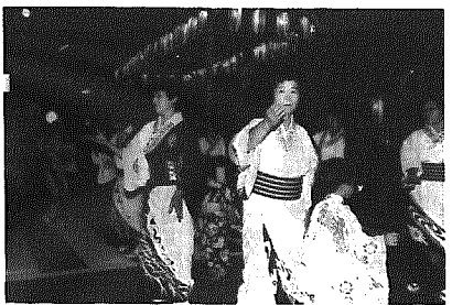
昨年の大民謡流し

E議員 黒埼まつりについて今年度の計画は。町長 黒埼まつり実行委員会では8月17日(土)、18日(日)を予定している。行事内容は、大民謡流し、お祭広場、野外ステージ、花火などを予定。具体的な詳細・内容は4月に入ってから黒埼まつり実行委員会会で検討することになっている。