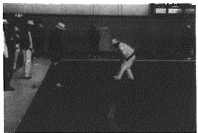
室内ゲートボール(総合体育館)

B議員 老人の体育向上に、室内ゲートボールの設置を。町長 緒立の2面が失われたが、史料館となり予定されている公園にと検討する。また大野大橋の下をゲートボール場にと提言。白根市だが、広域的に使用できるように。室内ゲートボールは総合体育館、北部地区公民館でマットを敷くかケマリを使うかすでにやっている。