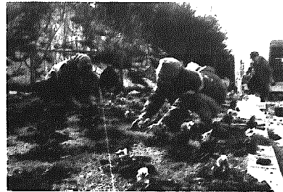
上/完成した自転車置場 下/花壇にパンジーを植える蓮方団地長寿会の皆さん

三月四日(月)、高速鳥原駐車場入口の花壇に、蓮方団地長寿会老人クラブの皆さんの協力でお花を植えました。植えたのは赤、青、黄色のパンジー合わせて約二百株で、高速バス停を利用される皆さんに親しんでいただけるようにとの願いをこめて植えました。「こういうのをいじっていると長生きできるんだよね」と花植えに参加した人の声。