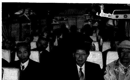
バスで各地を見学します。