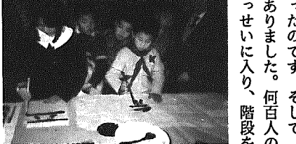
中国の書を作る児童と、交換する書を書いている青木さん。世界が平和であるようにと「平和」と書きました

私は、この冬休み、日中友好書道展で中国へ行ってきました。そして、北京、西安、上海を観光しました。三つのうち、印象的だったのが、二つあります。それは、北京のことですが、日中青年交流センター、中華全国青年連合会主催のレセプションと、万里の長城の見学です。