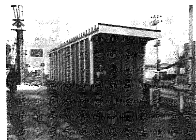
国道8号線ボックス

町長 町のイメージアップに と以前から検討していた。建 設省と協議し、住民ニーズに こたえたい。児童の絵を飾る ということでは、学校も検討 したが、スプレーで落書きさ れると児童にあたる影響も 大きい。