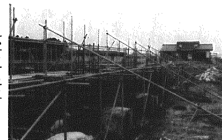
現在、工事中の老人福祉センター

老人憩いの家「黒埼荘」は、昭和四十六年十一月にオープン。木造平屋建てで、昭和六十二年の一部改築し、建物面積は七八八平方メートルでした。平成元年度は四四、五〇四人が利用。「黒埼荘」最後の日には木場老人会の約八十人のほか、何組かの皆さんが名残りを惜しんで集まりました。なお新しくできる老人福祉センターは、黒埼荘のすぐ南の土地に建設され、来年四月オープンの予定です。