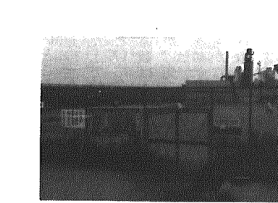
寺地テニスコート

G議員 町管理の社会体育施設、特に町営テニスコートの利用状況・管理運営は、今後の社会体育施設の拡充は。町長 町が直接管理している運動施設は、総合体育館・町営野球場2面・善久河川敷と寺地にテニスコート9面とゲートボール場5面。その他に本年度整備した体育館前の多目的広場。施設管理は、総合体育館は社会体育係が管理運営、野球場・テニスコートは黒崎町野球連盟・黒崎町庭球協会のみなさんの協力をえながら管理運営・施設整備、ゲートボール場は大きな大会を行う以外は黒崎町ゲートボール協会が自主的運営をしている。多目的広場は体育協会・関係団体と協議し、施設整備・管理に当たりたい。