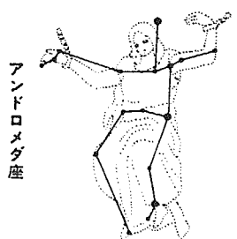
9月中旬、午後8時ごろ東の空に見えます。

天体観望会 秋の星空案内 ☐9月12日(水)21日(金)午後7時～9時 ※参加無料。当日、午後6時30分～7時に正面入口で受付。小学生は保護者同伴。雨や曇りの場合は中止。 おもしろ滑車の実験 ☐9月30日まで。平日…午後1時40分～55分、日曜祝日…午前11時20分～35分と午後1時40分～55分の2回 ☐組み合わせ滑車で自動車のような重い物を持ち上げてみよう。 プラネタリウム・9月15日から新番組「はるかな宇宙への旅」を放映 ※9月11日～14日は入替えのため休み