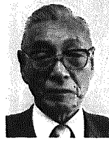
武田武夫氏 (木場2300番地、77歳)

※昭和二十二年から三十年まで黒埼村助役、三十二年から四十四年まで黒埼村長、四十六年から現在まで新潟県議会議員を務められた。六十一年七月から六十二年四月まで新潟県議会議長。