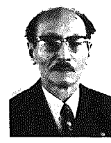
(故)赤沼教正氏 (鳥原1613の甲)

※昭和二十二年から三十年まで黒埼村助役、三十二年から四十四年まで黒埼村長、四十六年から現在まで新潟県議会議員を務められた。六十一年七月から六十二年四月まで新潟県議会議長。