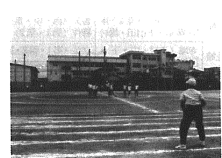
の整備事業に使われました。(写真は山田小屋外運動場)

簡易保健 役場庁舎増築工事 山田小屋外運動場 簡易保険、郵便年金資金とは、郵便局の簡易保険や郵便年金に加入されたかたから、払い込まれる保険料や掛金を将来の保険金、年金の支払いなどに備えて積立てられている資金です。 この資金は「簡保、年金資金」として、公共施設の事業に融資され、住みよい町づくりに役立っています。 平成元年度の当町では、この資金から6億5850万円の融資を受けて、役場庁舎の増築事業や山田小屋外運動場