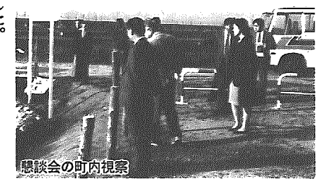
懇談会の町内視察

第2回は平成元年10月31日。町内の視察研修を行って、町民のアイディア等参考にして、意見集約していただいた。緒立温泉の掘削と人材育成に集約されたということで、全員から了承をいただいた。あとは内部で検討ということ。懇談会は2回で終わった。総務課長 職員の検討委員会の委員は19人。町民からのアイディアの内容を審査し絞るとい性格づけ。全体会議を4回開き、8案を懇談会に提出した。