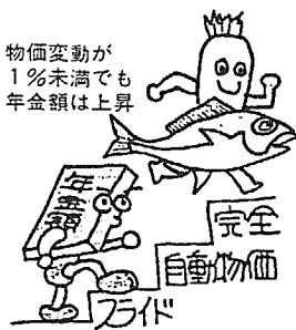
物価変動が1%未満でも年金額は上昇

⑦詳しいことについては、役場住民福祉課年金係(内線26)までお問い合わせください。