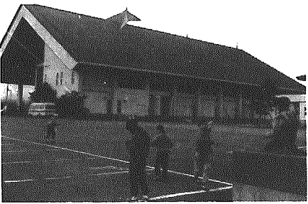
総合体育館前の広場で子供たちがタコ上げ (1月12日撮影)