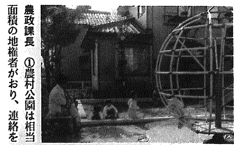
農政課長 ①農村公園は相当面積の地権者がおり、連絡を

F議員 公園問題について ①今後新しい公園の計画はあるのか、農村公園はどうなっているのか。②既設の公園の維持管理は。遊具がいたんでいたり、草ぼうぼうになっていたりするが。 町長 ①新しい公園は区画整理事業の中などで行いたい。信濃川河川敷公園を計画している。②ゲートボールなど利用者には後始末してもらおうもの、自治会に委託料を払って管理してもらおうものもある。