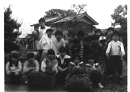
パーベナ・テネラを植える 木場の八割子供会

D議員 花と緑のあるまちづくりについて ①花づくりの輪が広がってきている。特にパーベナ・テネラは婦人会や子供会など町内あちこちで植えられている。パーベナ・テネラを町の花にする考えは。②金巻地内の池の周りに桜などを植え公園にしたら ③街路樹の計画は。④来年度、花の予算計上を。グリーン会議などを開いたらどうか 町長 ①以前、町の花の条例を検討したとき、チューリップ、菊など意見が分かれてできなかった。今後検討する。②木