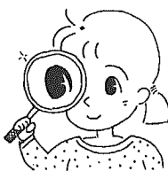
目の愛護デー (10月10日)

11月3日・4日 ※会場は総合体育館と環境改善センター 教育委員会 (☎377-5211)