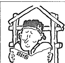
違反建築防止週間 (10月11日~17日)