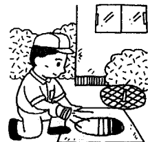
環境衛生週間 (9月24日~10月1日)

第17回町民バドミントン大会 10月15日(日) 午前8時45分 総合体育館 ※参加申し込み用紙が総合体育館窓口にあります。申し込み締め切りは10月4日(水)。 教育委員会 (☎377-15211)