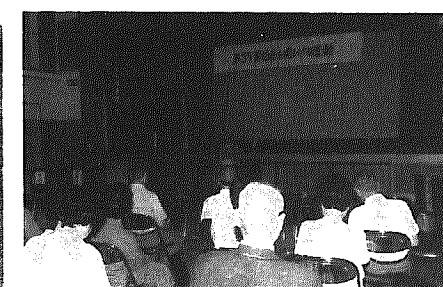
赤沼氏のあいさつ