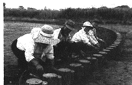
毎月5日が善久寿会の「社会奉仕の日」