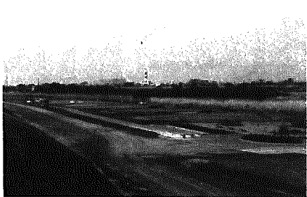
河川敷公園。総面積7.8ha(計画)

A議員 職員定数について ①職員の数は適正かどうか ②パート職員の数と身分保証はどうなっているのか。黒崎町臨時職員の給与支給規則があるが。 町長 ②パート職員数は総務課2、町史2、税務2、住民福祉2、保育所11、保健衛生2と6か月ごとの契約。再契約する場合もある。規則は昭和42年のもの。見直したい 高速バスを鳥原に停めてほしい 都市と都市を結ぶもので難しい A議員 北陸及び関越自動車道の高速バスの運行について