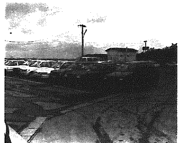
鳥原バス停の駐車場

鳥原停留所に池袋行き及び大坂行きのバスを停められないのか。 町長 難しいが、努力する。企画開発課長 高速バスは都市と都市を結ぶもので、黒崎は新編圏域に位置づけられており、鳥原に停めることは難しい。しかし、停車場の拡幅整備など町としてもそれなりの努力は続けていきたい。