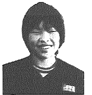
パチパチチパチ……と、塞の神の火が音をたてて燃えています。毎年、この火を見る度に、「ああ、もう正月は終わったんだ」という実感がわいてくるのです。この「塞の神」というのは、よくいわれる「どんど焼き」のことで、お正月用品や書き初めその他を燃やします。この行事だけは、毎年家族で参加して、一年中で一番私の好きな行事です。