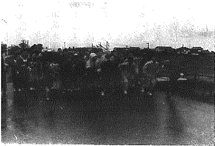
午前10時、いっせいにスタート