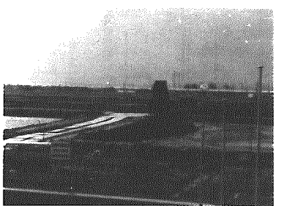
総合体育館前の中間処理場