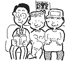
成人病予防週間 (2月1日～7日)