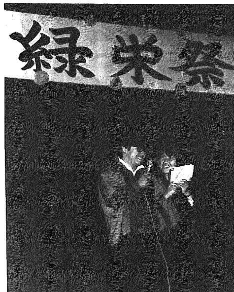
生徒と先生の楽しいデュエットも

一般公開は二日目です。クラスが中心になり、さまざまな展示や催し物をしていきます。一年から三年まで全部