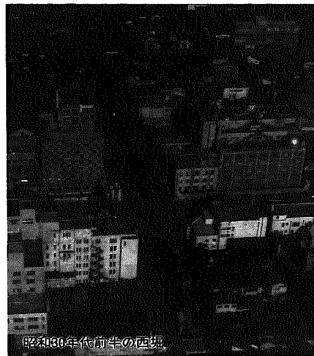
昭和30年代前半の西境

会期：6月9日(木)～12日(日) 午前9時～午後5時 会場：北部地区公民館 2階会議室