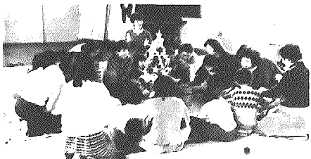
昨年のおすなる会クリスマスパーティー

心身に障害を持つ子供たちの視でつくっているあすなる会では、学齢期を過ぎた知恵遅れの人たちが、自宅から通って軽作業をするための作業場をつくることを考えています。このたび、大野小学校の文