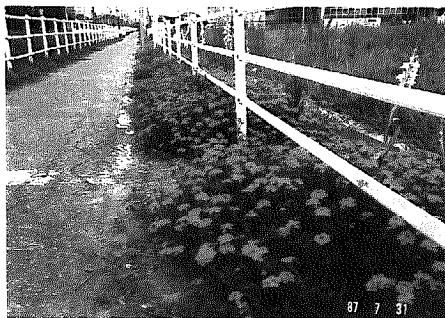
今年5月に植えたパーベナテネラ

花を通して地域のコミュニケーションを図り、さらに皆さんからチューリップに親しんでいただこうと、黒埼町花と緑の会では、黒埼町農協青壮年部の協力を得て、八重咲きチューリップの植えつけを行います。