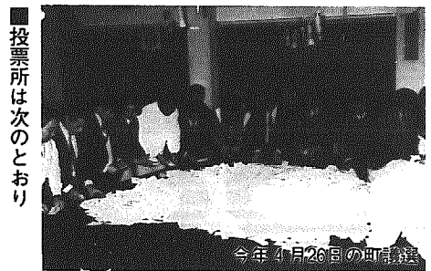
投票所は次のとおり

投票日に所用やレジャーなどを予定し、投票できない人は七月二十一日から二十五日まで選挙管理委員会に不在者投票ができません。 手続き：本人自ら選挙管理委員会(役場二階不在者投票所)で「宣誓書」を提出し不在者投票をします。「宣誓書」は選挙管理委員会に用意してあります。印鑑が必要です。 証明証は選挙管理委員会が発行します。 分が投票したい候補者の欄に○印をつけてください。 ○印以外に他の字や×印をつけると無効になりますから注意してください。 ◎町内で転居した人の投票所 昭和六十二年六月十九日以降に町内で転居した人は前の住所地の投票所で投票します。入場券をお確めのうえ、間違いのないようにしてください。