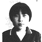
今、「いじめ」が、たいへん大きな社会問題になっています。わたしたちの学校でも「いじめ」が、いくつかあります。「いじめ」のために一生に一度しかない中学校生活に嫌な思い出ばかりが残ってしまったら、とても残念なことだと思います。

わたしは今まで「いじめ」についてあまり深く考えたこととはありませんでした。しかし、先日、そのことについて少し考える機会がありました。それは道徳の時間に卒業生で、ものすごいいじめにあった人が書いた作文をみんなで見ました。 その生徒は、小学校のときからみんなにいつも「しよつたれ、しよつたれ」と言われてきたり、中学校に入ってから「いじめ」は、もっと大きくなり、鉛筆を持ってくるたびにすぐに全部折られたり、自分が大切にしていたものを壊されたり、なくなったりしました。このような持ち物に対する「いたずら」だけでは治まらず、ついに身体に対する「暴力」によって、骨折。そして入院までしてしまいました。 本当にひどいことです。そんなとき、いじめていた人は、どんな気分になっていたでしょう。決して良い気分ではないと思います。しかし、その生徒の作文には「入院中には、いじめられることもなくともよかったです」というようなことが書いてありました。 わたしは、いじめられる人というの、心がどこか曲がっているから、人をいじめられるのだと思います。しかし、それを読んで、いじめられた人も雲がかかったような暗い心になつてしまふのではないかと思いました。 また、授業中にだれも発言しようとしないうちにその生徒が積極的に手を上げて、意見を述べたり、質問したりすると、後でひやかされたり、無視されたりしました。なぜ、このような良いことをした人をひやかしたりするのでしょうか。「自分にはできないのだから、自分にはできないのだから、自分にはできないのだから」といって、人をひやかす。これが、わたしたちの話し合いの結果とまってきたことです。 また、先生は「人間はだれ