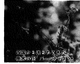
四国から送られてきた苗木の花「ハーベグアテラ」

河川敷公園は町が造成中で、すべて完成すれば七万八千平方メートルの大公園になります。既に広場やテニスコート、ゲートボールコートが出来、利用者も徐々に増えてきています。しかし、赤土と水はけが悪い