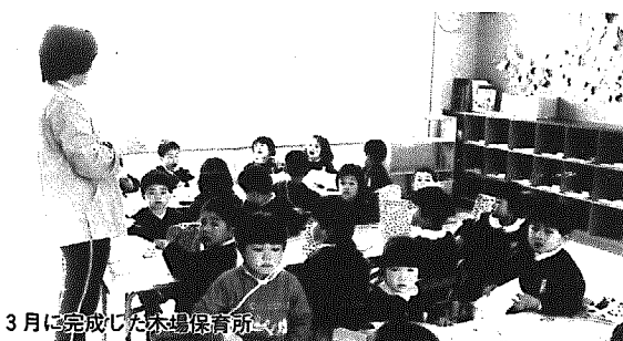
3月に完成した木場保育所