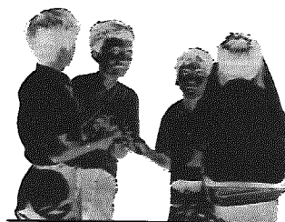
昨年200人が補導される

県警では毎年度県下6中学校区を「少年を非行から守るパイロット地区」に指定し、家庭、学校、地域社会が一体となった総合的効果的な非行防止活動を推進しています。今年度(4月1日)来年度(3月31日)その1地区に黒埼中学校区(黒埼町)が指定されました。黒埼町で昨年度、補導された少年