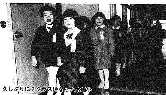
久しぶりに2クラスになった木場小