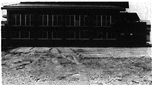
900㎡の町民手づくり庭園予定地

募集している庭木…松を除き種類は問いません。できたら幼木の方がよいです。 植栽日…6月8日(日)午前9時。 運搬方法…当日、環境改善センターまで持ってきてください。 申込み、問い合わせ…役場農政課へ5月末日までに。