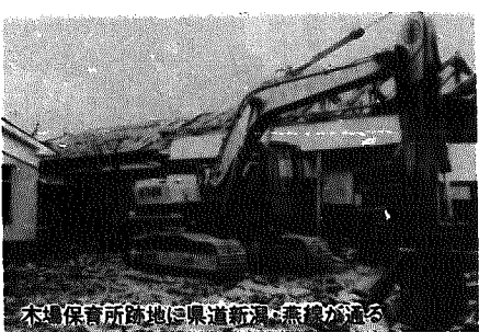
木場保育所跡地に県道新潟・燕線が通る

益までには決めた。通学区分の変更は考えていない。 80%完了。残る一戸と交渉したい C議員 県道新潟・燕線の工事促進と木場保育所跡地について 木場地内用地買収がほぼ完了しているが、①工事と経過は、②今後の工事促進の見通しは、③木場保育所に隣接している木場保育所の跡地の残りとの交渉はどうか。 建設課長 ①用地買収は80%完了した。家は4戸かかり3戸は譲渡していただいた。②残る1戸がなかなか協力してもらえない。町も何回か足を運んだが、今のところ話に乗ってもらえない。今後、いろいろと考えていこう。 住民福祉課長 木場保育所の跡地は白紙である。