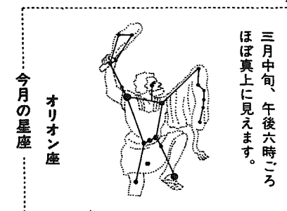
オリオン座 今月の星座

NHK学園 NHK学園では、生涯学習講座の春の受講生と高等学校の生徒を募集しています。 ①生涯学習講座 古典、漢詩、文章、美しい日本語、国語、英語、数学、簿記、母と子の書き方、母と子のリズムあそび、ファミリー写真、ビデオカメラ、書道、硬筆、絵画、囲碁、園芸、俳句、短歌、川柳、小論文・作文セミナー、リーダー養成塾、俳句友の会、短歌友の会 申込受付 2月15日～4月15日 受講料 1万～2万円ほど ②高等学校 普通科コース(通信教育) 申込受付 3月1日～4月7日 授業料 年額5万5千円 ☆詳しい案内書をご希望の方は、お近くのNHKまたは〒186東京都国立市富士見台2-36 NHK学園8E11係に