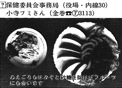
あえごろもはみそと砂糖を除けばアレルギーにも合います

材料(4人分) 大根……130g にんじん……30g しいたけ……4枚 コンニャク……1/2 [あえごろも] 豆腐1/2……200g ゴマ……大きじ2 砂糖……小さじ2 白みそ……40g 塩……小さじ1/4 みりん……小さじ2 淡口しょうゆ小さじ1/2