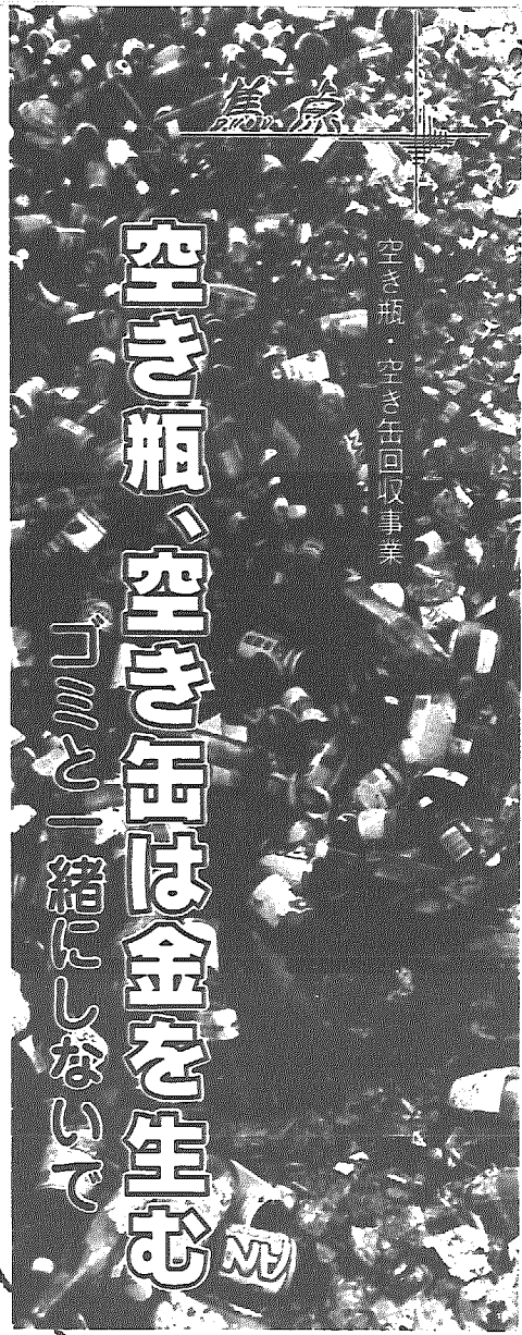
空き缶・空き缶回収事業