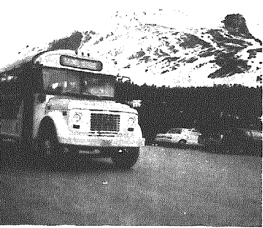
氷河を走る観光バス

オンタリオ湖北西岸に位置し五大湖水運の重要な港湾都市として年間二千隻が利用し商業が盛ん。降雪はせいぜい五〇〜六〇センチ、零下三十五度。たまに五〇〜六〇kmの強風があるというが、日本の風速はmなので若干違いがある。 この日はシエラントホテルに泊まる。創設者はインディアンに功績のあった人の名を残し命名したそうである。夕食はザ・フォックスヘッド。夕食後ナイアガラ夜の滝を見学する。色とりどりの照明によってすばらしい景勝とその雄大さに感動する。 五月三十日第五日目。ナイアガラを船で見学。温度は七度と寒い。近くの公園でチューリップと八重