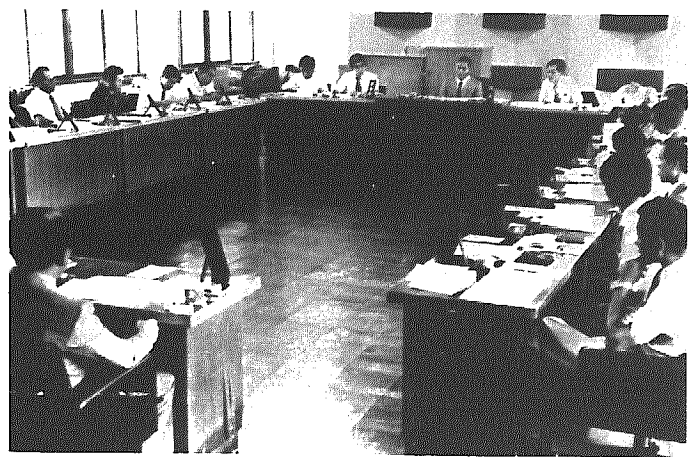
農業委員会 7月26日役場議場