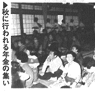
秋に行われる年金の集い

国民年金の保険料は、所得の多少にかかわらず、定額制で昭和五十八年四月からは月額5,830円になっています。 これは五十六年度の保険料額4,500円を基本として、毎年350円づつ加算した額に、以後の物価上昇によるスライド率を乗じたものが、このように350円加算してくと五十九年度の保険料は5,550円になります。五十八年度までの物価スライド率が一・二二であるため、2,220円となります。