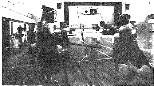
十一月十三日、総合体育館で行われた武道祭。子供から老人まで多数参加した

形成の道といわれます。最近日本の武道が心身を同時に鍛練する人間形成の道として全世界の評価が高まりつつあるともいわれ、世界的に普及しつつあるといわれます。武道を志す者として非常に喜ばしいことです。昔から徳育抜きの体育は粗暴の人を作り体育抜きの徳育は口舌の人を作るといわれて居ります。武道に勉み豊かであつたまじい精神生活とが共存する活力ある社会の実現を確信しつつ、これからも努力して行きたいと願うものであります。一粒の汗を流しながら。