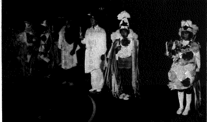
▲フィナーレのキャンドルサービス

新しい友との出会いを大切に、テーマに主催者のあいさつ、リーダー紹介、ウォーミングアップと見事な演出で参加者の緊張をといてくれました。 自分の頭と体を使ってのゲームの数々、ジャンケンあり、ダンスあり、合唱あり三十分もすると汗ばむほどの熱気です。知らない者同士にもかかわらず腕をくみ、肩に手をかけ十年来の友のような錯覚を持ちました。 サッカー、ジャンケンやトランプゲームを盛り込んで体育館狭しといた感じに熱気あふれたインドアアスレチック。ジリジリと照りつける太陽の下汗をふく暇もなく地図をたよりに大野町を駆けずり回ってチェックポ