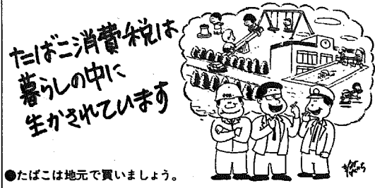
●たばこは地元で買います。