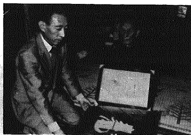
9月17日、90歳以上の老人に長寿を祝って賞状と座ぶとんの配布

門の先生から受けたのは生まれ初めで実を打たれた。手、足の動かし方、目配りももちろん、作詩、作曲にびつたりと合った踊りの心をやっとならぬことには実に恥ずかしい生懸命勉強したいと思う。