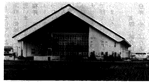
総合体育館(教育委員会)