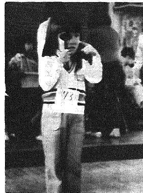
新一年生は健康かな 来年度各小学校に入学する新1年生(329人)の健康診断が11月に行われました。写真は山田小での視力検査