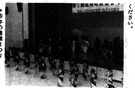
▲昨年の農業まつり

◆問い合わせ 申込み手続など、詳しいことについては県民会館事業課 ☎(0252)28-4481へ。